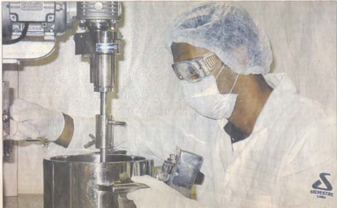
Silvestre Labs, pequena empresa do setor químico, foi a primeira colocada no segmento de média-alta intensidade tecnológica e sobe essa conquista a partir do seu alto índice de inovação

A elaboração do ranking é feita com base em inscrições voluntárias das empresas e a partir de números divulgados pela Pesquisa Industrial de Inovação Tecnológica (Pintec), realizada pelo Instituto Brasileiro de Geografia e Estatística (IBGE). Essas informações são usadas como princípio para uma fórmula que compreende 15 indicadores. São levados em conta pesquisas e desenvolvimento, contratação de doutores e mestres, inovação de máquinas e equipamentos e licenciamento de tecnologia. Todas essas características contam pontos